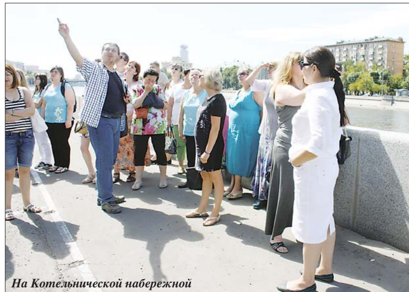
На Котельнической набережной