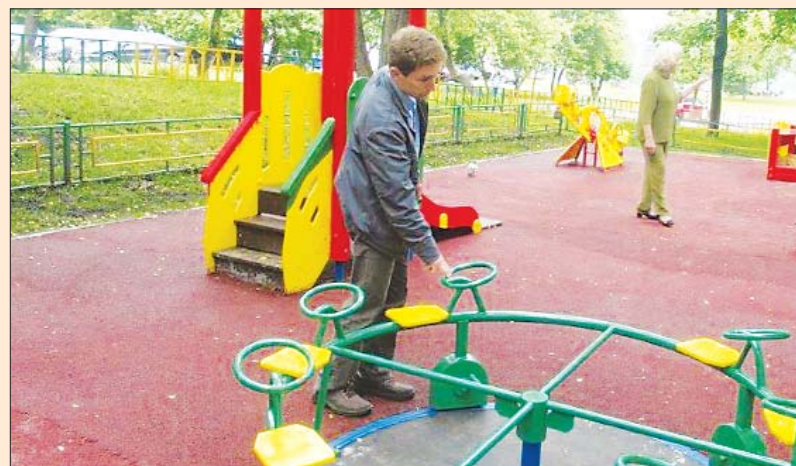
Депутаты проверяют качество ремонта детской площадки

Запланированы ремонт контейнерной площадки, устройство гостевых парковочных карманов,